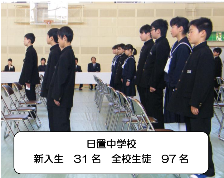
日置中学校 新入生 31名 全校生徒 97名