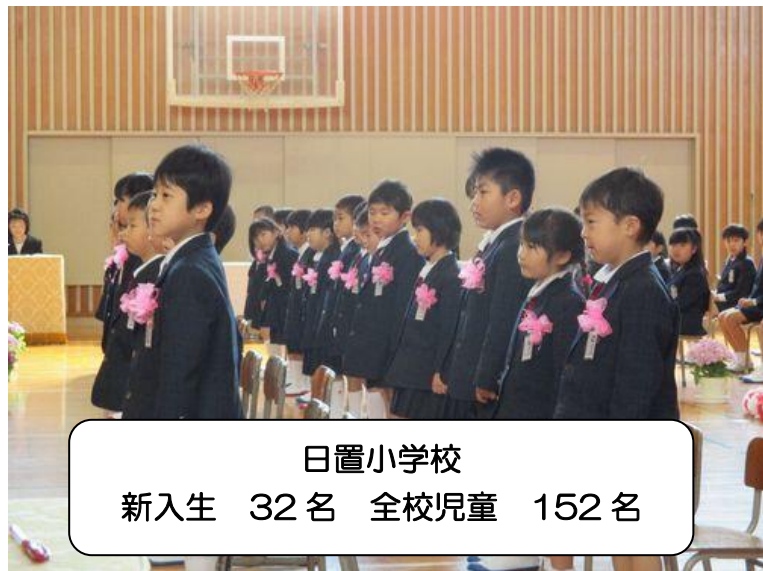
日置小学校 新入生 32名 全校児童 152名