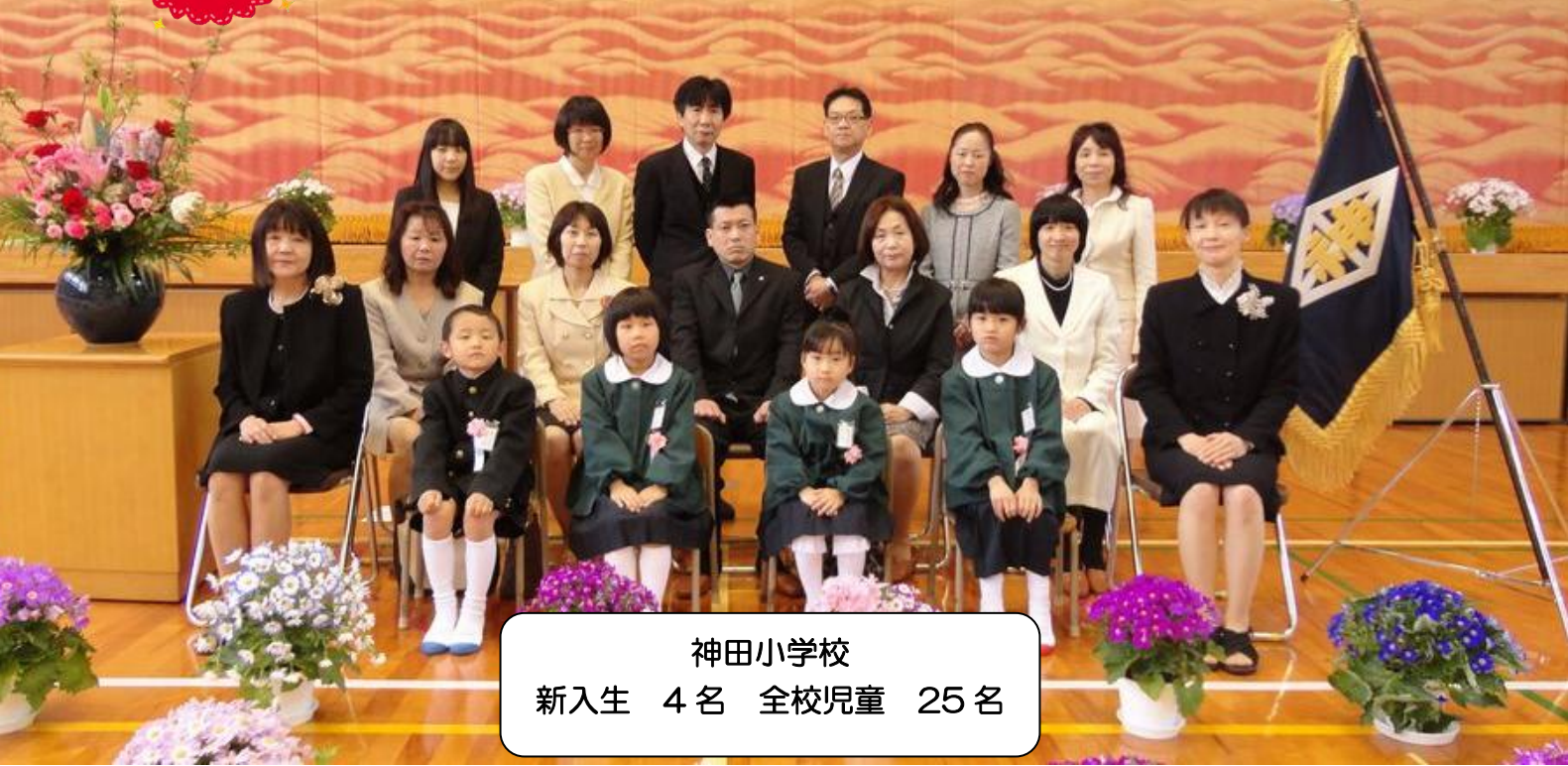
神田小学校 新入生 4名 全校児童 25名