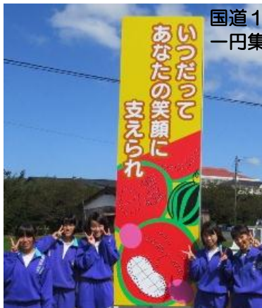
国道191号線 一円集会所付近