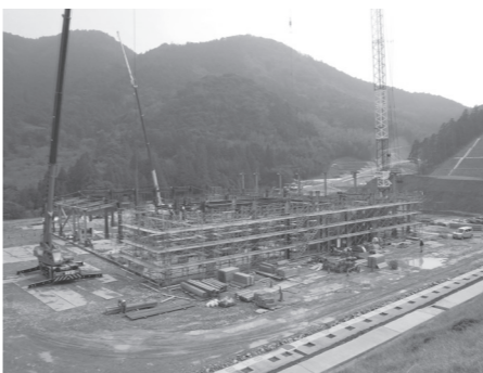
▲建設地のようす(2月下旬)