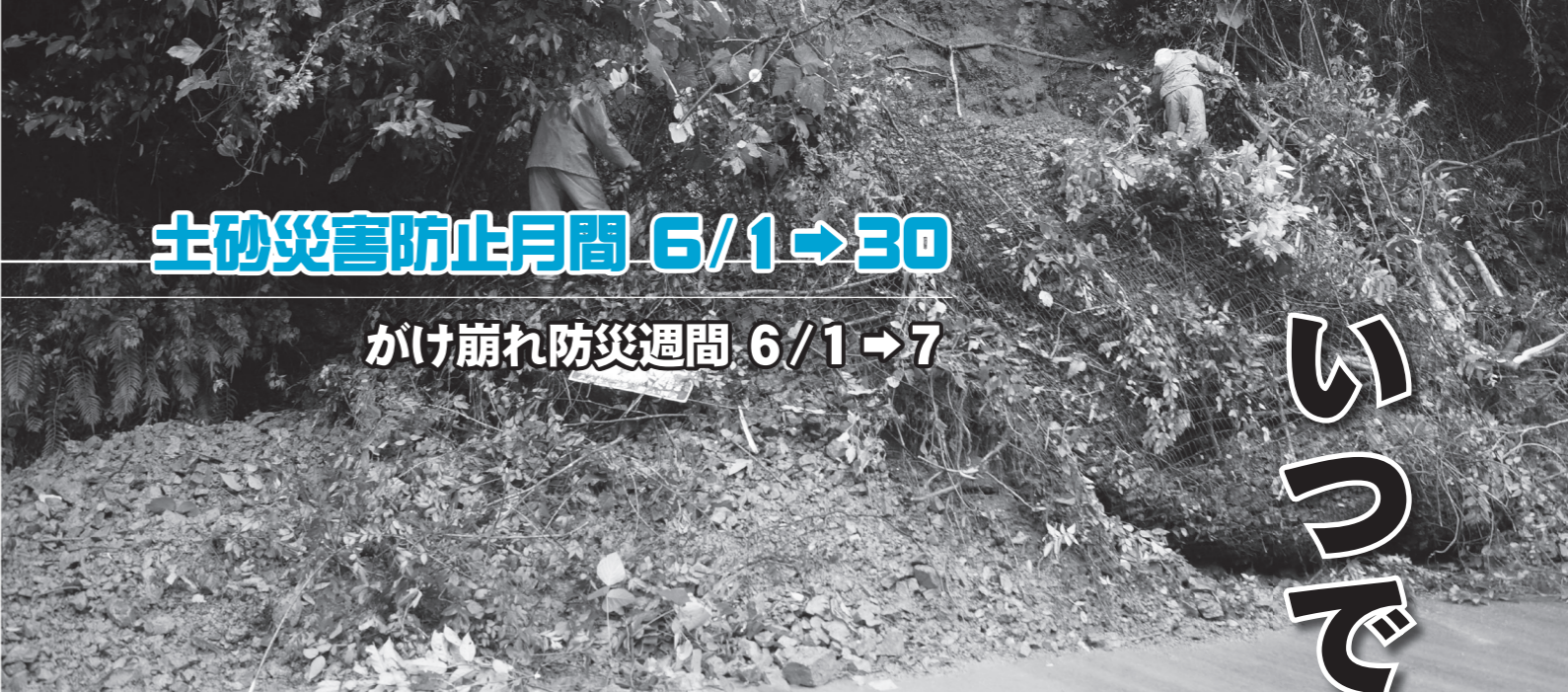
▲平成 25 年 9 月に発生した土砂崩れ（俵山地区）