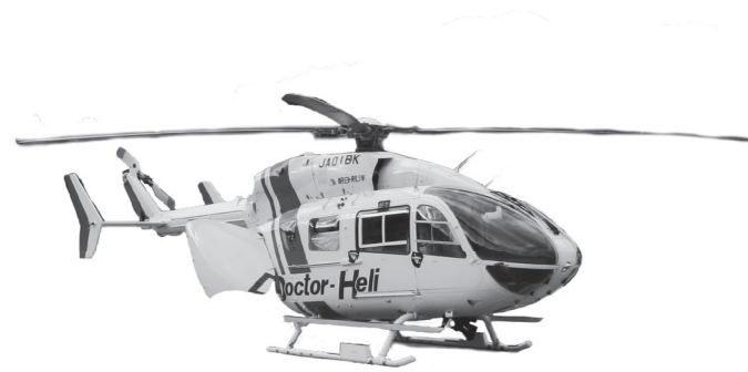
▲命をつなぐドクターヘリ

現場要請とは、心筋梗塞、脳卒中といった専門的な治療を早急に行わなければならない生命に危険が生じる時や、後遺症が残ることが予想される時、