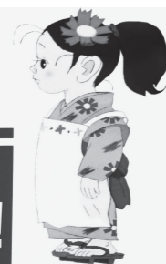
▲救急車の後部ドアに貼られているステッカー