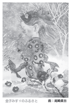
金子みすゞのふるさと 山口県長門市 画:尾崎真吉