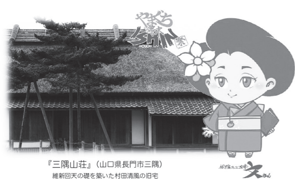
『三隅山荘』(山口県長門市三隅) 維新回天の礎を築いた村田清風の旧宅