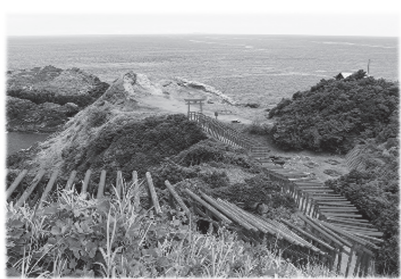
元乃禰稲成神社(山口県長門市油谷津黄)