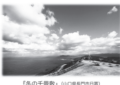
『冬の千畳敷』(山口県長門市日置) 第1回長門市観光フォトコンテスト～ながと原風景～応募作品