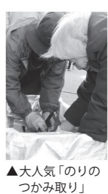
▲大人気「のりのつかみ取り」