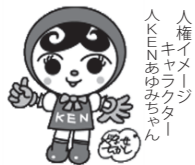
人権イメージキャラクター KENまもる君