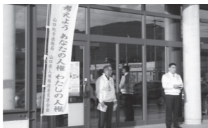
▲街頭や(上)ふるさとまつり(下)での「街頭啓発」

市では、人権に関する啓発のための、街頭やイベント時に人権について呼びかける「街頭啓発」、保育園でのキャラクターを使った「出前講座」、小学校で花を植える「人権の花運動」などを行っています。