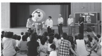
▲三隅保育園(上)、みのり保育園(下)での「出前講座」