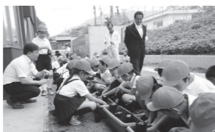
▲深川小学校(上)神田小学校(下)の「人権の花運動」