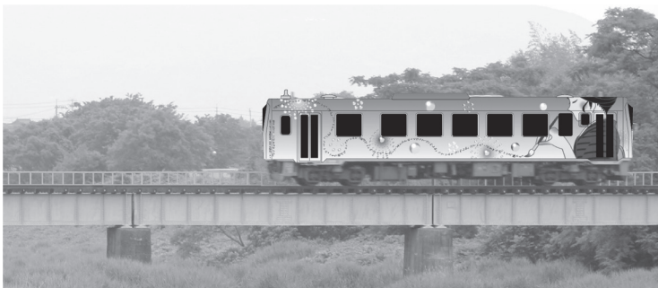
▲車両側面のイメージ図

JR美祢線では沿線3市（長門市、美祢市、山陽小野田市）の特徴的なイラストの描かれたラッピング車両が3月下旬から随時運行しています。カラフルな車両が美祢線の景色を違ったものにしていきます。