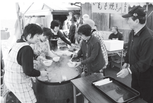
▲猪肉の入ったＹＹいがみ鍋もあります