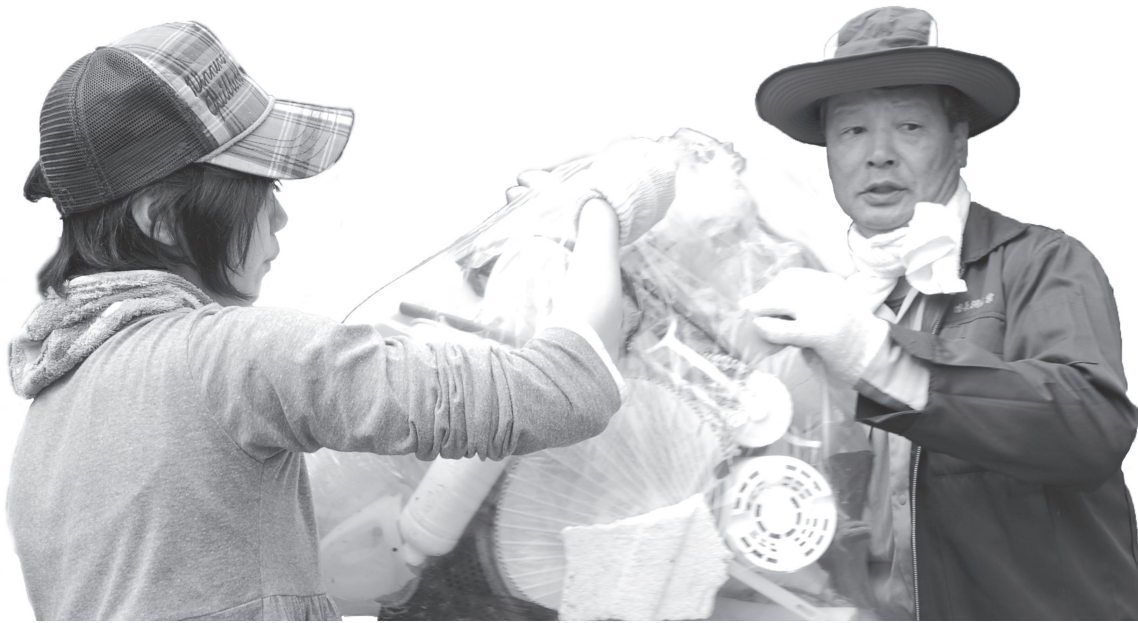
「母なる海を守る会」による海岸清掃で協力して漂着ゴミを運ぶ

市民が、住むことに喜びを感じ、誇れる豊かな地域社会を実現するため、市民の皆さんと行政がお互い考え、自らが持っている良いところを出しあい、行動する「市民協働」によるまちづくり・地域づくりが求められます。