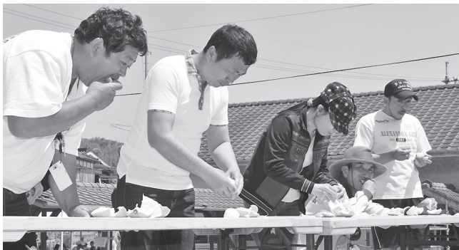
▼こちらは恒例の夏みかん早食い選手権