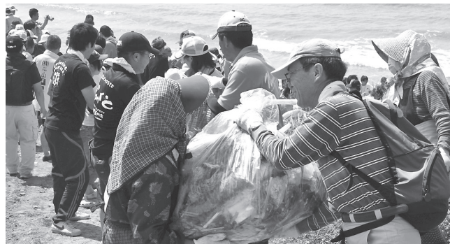
▼ごみ収集車までリレー方式でごみを運ぶ