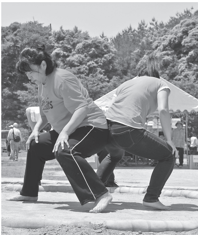
▲初開催の女尻相撲は真剣な闘いぶり