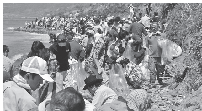
▲海岸が見えなくなるほどの多くの参加者がごみを拾う