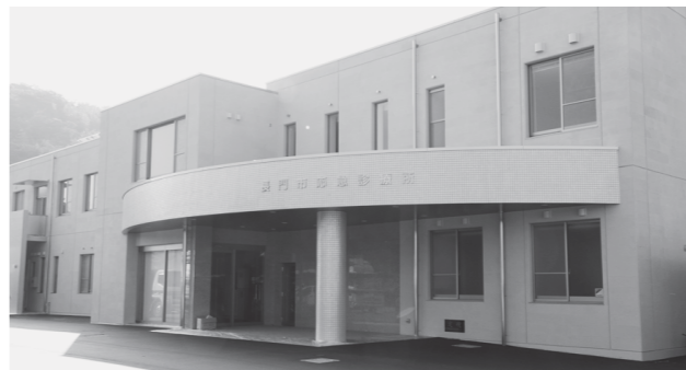
▲長門市応急診療所外観

問い合わせ 健康増進課（長門市地域医療 連携支援センター内） Tel.27-0255