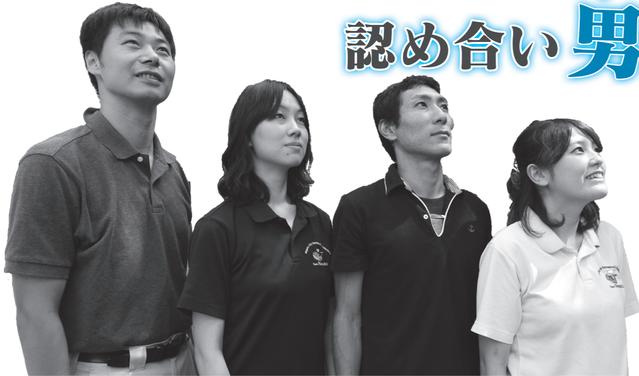
男女共同参画社会のイメージ図（内閣府男女共同参画局）

男女共同参画社会形成の基本は、金子みすゞさんの詩「私と小鳥と鈴と」の「みんなちがって、みんないい」にもあるように、お互いを認め合い、ともに生きようとする、人権が尊重される社会です。