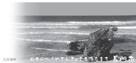
大浜海岸 日本心「やさしさを奏でるまち」長門市