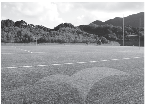
愛称名:「依山スタジアム」