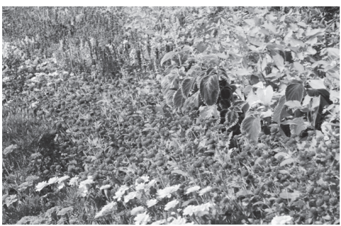
▲2年連続市長賞を受賞した小波橋花壇(三隅地区豊原)