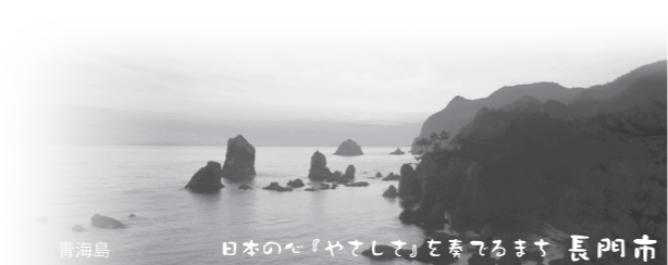
青海島 日本心「やさしさを奏でるまち」長門市