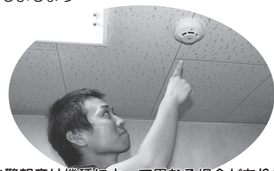
※警報音は機種によって異なる場合があります