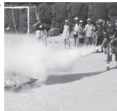
▲消火訓練のようす

一日消防署長任命! 火災予防を市民に幅広く伝えるため、一日消防署長を任命します!