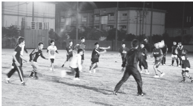
▼指導者も交えてタッチフットボールを楽しむ