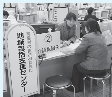
▼相談窓口のようす

適切なサービス提供に関す ること ・ケアマネジャー(介護 支援専門員)への助言や 支援