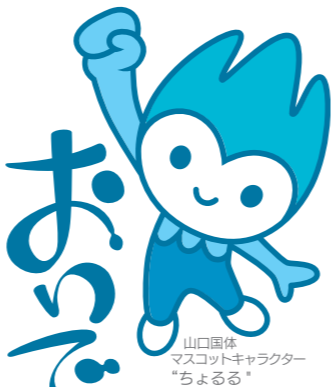
山口国体 マスコットキャラクター "ちよるる"