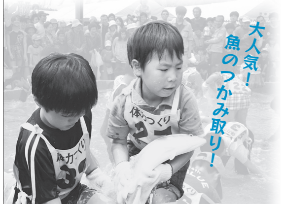
大人気! 魚のつかみ取り!