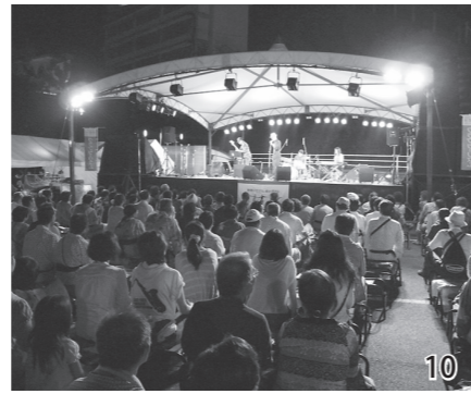
① VOISの演奏（メインステージ）②フレアバーテンダーのカクテルショー③松田真朝のフルート奏者④ you-jinのトランペット奏者⑤グルメバザーコーナー⑥ビッグバンド楽々団の合奏⑦音信川に音色が響く恩湯下ステージ⑧ワイン＆ローゼスのドラマー⑨満員となったメインステージ観客席⑩メインステージのようす