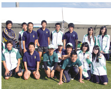
▲高校生の競技会補助員も大活躍しました

なお、長門市広報12月1日号において、「おいでませ！山口国体」の特集を予定しております。