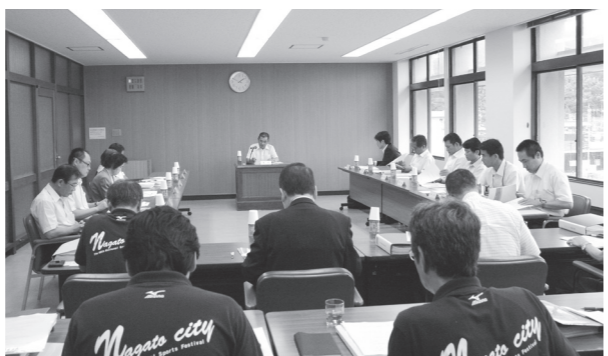
▲長門市水産物販路拡大推進計画策定委員会