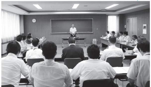
▼長門市農産物等直売施設整備基本計画策定委員会