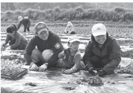
▲今年のはなっこりー一植え付けの様子

3年目を迎えた「はなっこりーのオーナー制度」。今年10月17日に、市内外から参加した18組・38名の親子連れでにぎわうほ場で、午前10時から約2時間かけて苗の植え付けを行いました。朝方降った雨で足元の悪い中、皆さん移植ごてを片手に1区画1.3m×25mの畦にはなっこりーの苗の植え付けをしました。お昼には、全員で今年獲れたひとめぼれで握ったおむすびと豚汁、はなっこりーの和え物で昼食をとり、お互いに交流を深めました。そして、ヒトメボレ5kgを手みやげに解散しました。参加者の中には、オーナー