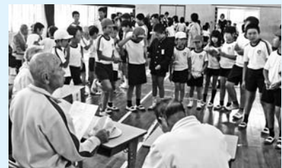
「先輩先生に学ぼう」の様子