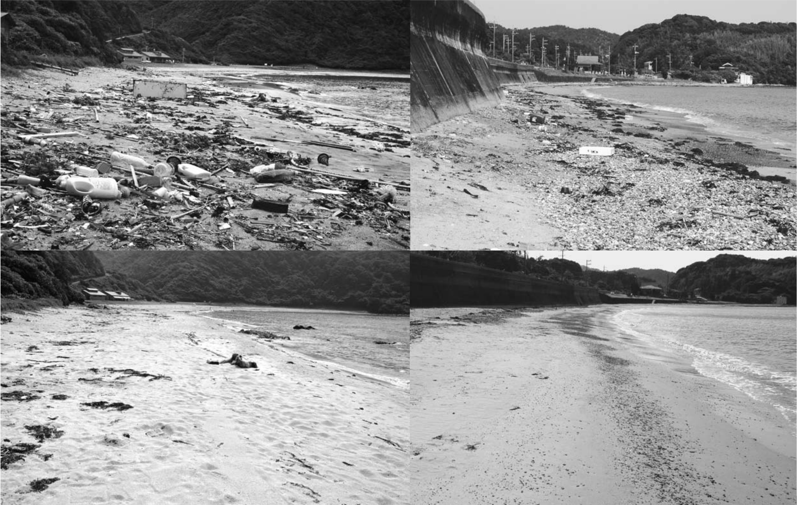
①清掃前の只の浜②清掃後の只の浜③清掃前の二位の浜④清掃後の二位の浜⑤集まったごみ（さわやか海岸）⑥集まったごみ（船越）