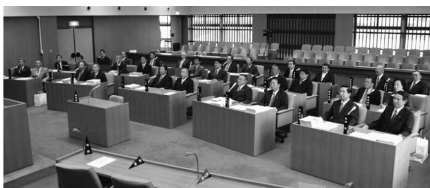
豊浦大津環境浄化組合議会議員