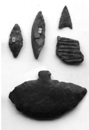
出土品(土器片・石器類)

日置と油谷にまたがる雨乞山(標高347m)の中腹に広大な台地がある。そこは第二次世界大戦後に入植した人々によって開墾され、現在は畑耕作地となっている。この開拓によって遺物が表土に露出し発見された。 採集された遺物は、縄文時代早期から前期にかけての縄文式土器や石器類と弥生時代中期頃とみられる土器片などである。