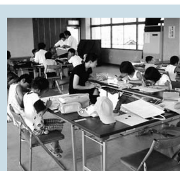
夏休み学習お助け教室(昨年)

今回は8月に開催する学校、家庭と連携した事業を紹介します。すいすいサマースクール 夏休み中に小学校と公民館がそれぞれ行ってきた「サマースクール」と「夏休み学習お助け教室」を合体させ、より内容を充実させ