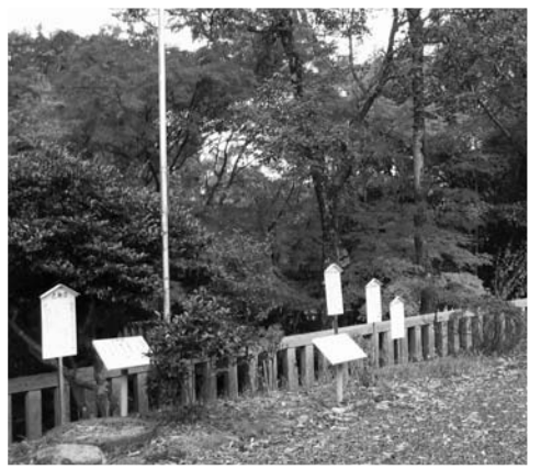
八幡人丸神社古典樹苑

油谷新別名にある八幡人丸神社は、九州から石見へ向かう途中にこの地に滞在したと伝えられる万葉の歌人・柿本人麻呂を祀る神社である。明治四十年(一九〇七)、弓弦葉山八幡宮(新別名八幡宮)に人丸神社を合祀