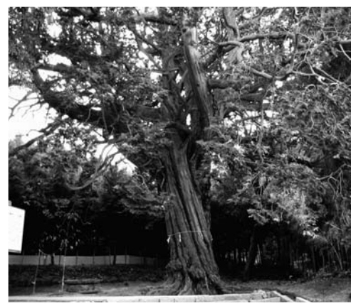
八幡人丸神社御旅所のヒノキ巨樹

油谷新別名にある八幡人丸神社は、九州から石見へ向かう途中にこの地に滞在したと伝えられる万葉の歌人・柿本人麻呂を祀る神社である。明治四十年(一九〇七)、弓弦葉山八幡宮(新別名八幡宮)に人丸神社を合祀