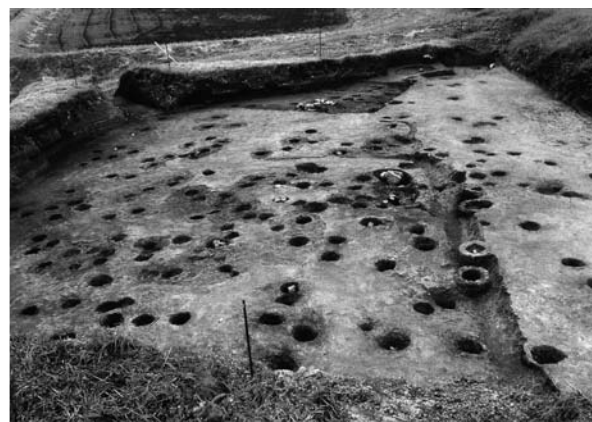
発掘調査当時の湯免遺跡 (平成12年調査)

古墳時代は、方形竪穴住居跡があり、北辺中央部には粘土で構築されたカマドが確認された。住居跡からは、土師器の鉢やミニチュア土器などが出土したほか、カマド内に土師器の甕、甌が破砕された状態で発見され、祭祀行為の存在をうかがい知ることができるとも、平安時代前期の須恵器や後期の輸入磁器などが出土したほか、中世