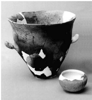
竪穴住居跡から出土した土器類

この遺跡は、昭和四十二年、通称周田川山北斜面の開墾時に発見されたもので、昭和五十三年の県営圃場整備事業と平成十二年の町道改良工事に伴い、山口県教育委員会による発掘調査が実施され、弥生時代前期末(紀元前