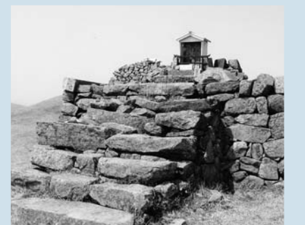
花尾山山頂に取り付けた基壇の祠

長門わらじ会は、山歩きを通して「自然を愛し慈しむ気持ち」を育み、己を鍛え仲間同志の親睦」を目的に、昭和57年12月に発足しました。 昭和58年から平成17年まで23年間、毎月1回の登山を行っています。単純に計算すると延べ270あまりの山を歩いたこととなります。現在の会員は36人で、下山時には空き缶などのゴミを拾うことを習慣としています。 「長門富士」とも呼ばれる花尾山は県内でも五指に数えられる名山ですが、山頂の歴史ある石像が長年風雨にさらされてきました。今年に入っ