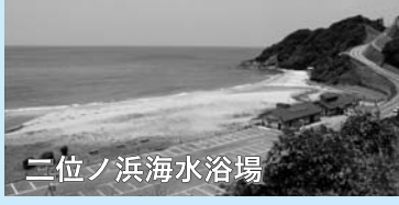
シャワー(有料)・トイレ・駐車場有 問い合わせ 日置総合支所経済課 TEL 37-2168