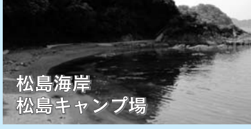
シャワー(有料)・トイレ・駐車場有 問い合わせ 松島キャンプ場管理棟 TEL 43-1893