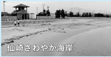
シャワー(有料)・トイレ・駐車場有 問い合わせ 水産課水産係 TEL 23-1145