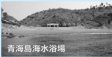
シャワー(有料)・トイレ・駐車場有 問い合わせ 商工観光課観光振興係 TEL 23-1137