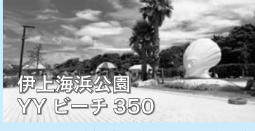
シャワー(有料)・トイレ・駐車場有 問い合わせ 油谷総合支所経済課 TEL 32-1190