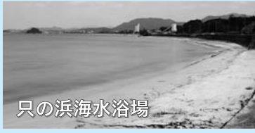
シャワー(有料)・トイレ・駐車場有 問い合わせ 商工観光課観光振興係 TEL 23-1137