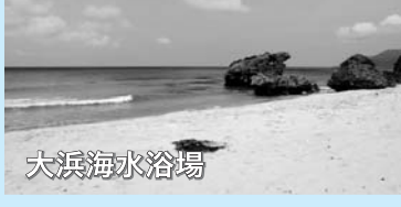
シャワー(有料)・トイレ・駐車場有 問い合わせ 油谷総合支所経済課 TEL 32-1190