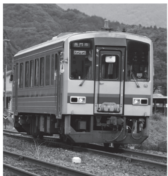
▲美祿線(長門市行き)