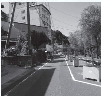
▲狭さく部を設け、歩ける温泉街に

また、まちに活力を生み出すには、地域住民との協働はもちろん、既存のお店や新しいお店といった民間事業者の参画も必要です。2年前、旅館経営者や萩焼作家など地域の若者たちが立ち上がり、長門湯本温泉に20数年ぶりとなる新しいお店、萩焼ギャラリーカフェ「カフェ&ポタリイ音」をオープンしました。空いていた民家を改装する