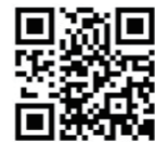
▲乗ろうよ！美祿線公式サイト

JR美祿線利用促進協議会ならびに長門市JR利用促進協議会では、JR美祿線利用に対して各種助成事業を実施しています。