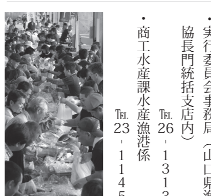
上保安部巡視艇「はぎなみ」の一般見学を行います。 問い合わせ ・実行委員会事務局(山口県漁協長門統括支店内) Tel.26-1313 ・商工水産課水産漁港係 Tel.23-1145

新鮮な魚介類を格安で販売する直売会、せりの雰囲気味わえる模擬せり、魚のつかみ取りやお楽しみ抽選会など、さまざまなイベントを実施します。 また、無料配布コーナーでは仙崎イカー一夜干しを配布します(先着200人・要整理券)。 展示コーナーでは、水産研究センターの研究発表や、仙崎海