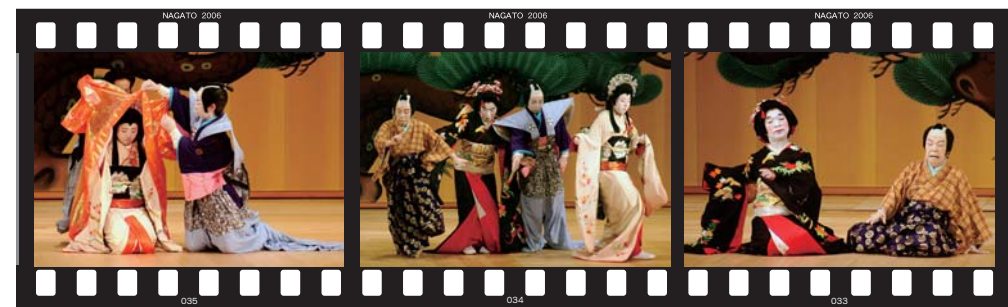
俵山女歌舞伎保存会「釣女」