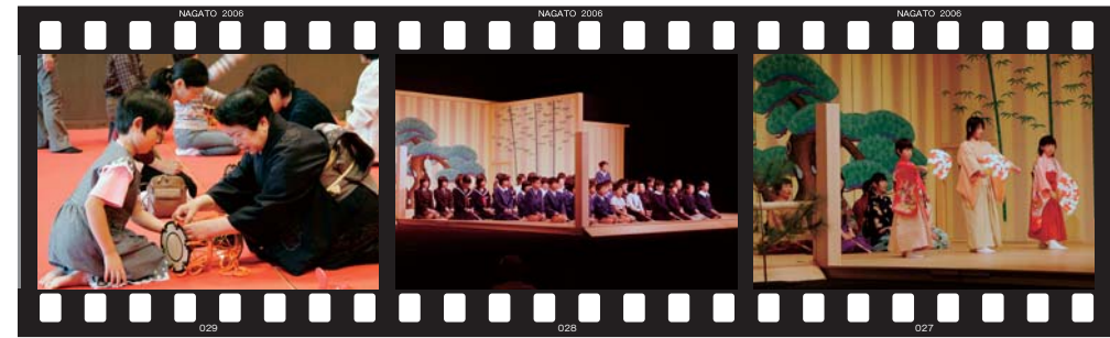
楽器体験教室 子ども能楽クラブ・素謡「狸々」 子ども能楽クラブ・仕舞「羽衣」