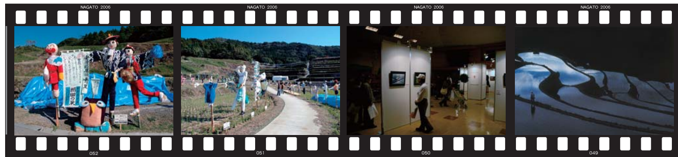
一般の部大賞「棚田米PR」フレッシュサロン稲石 東後畑の棚田と78体のかかし 力作揃いの棚田写真展