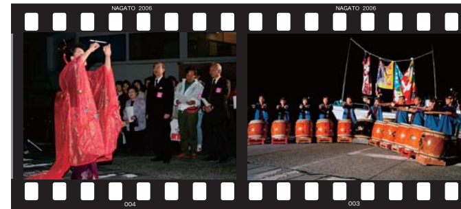
会場には二井県知事も