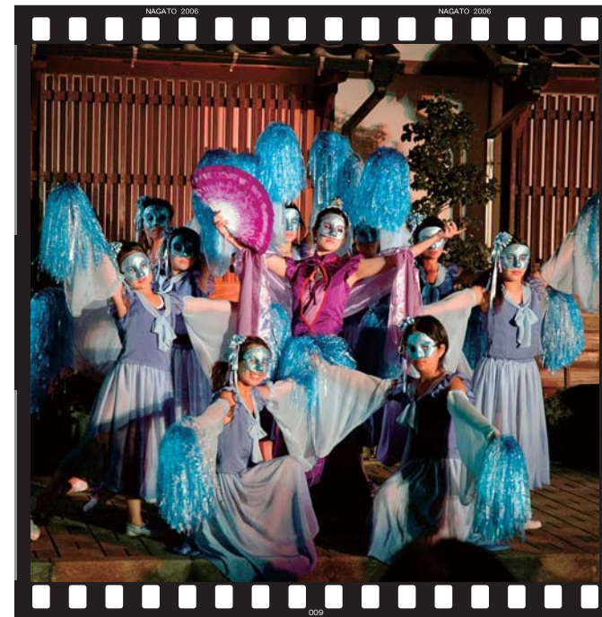
海のお宮・仙崎駅