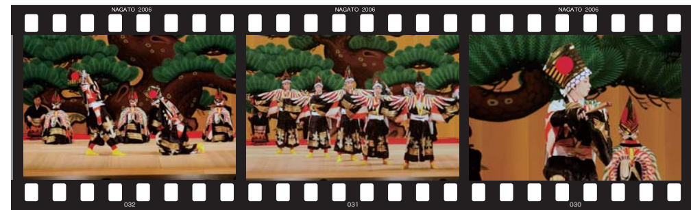
俵山中学校子ども歌舞伎 義太夫 寿式「三番叟」(五人三番)