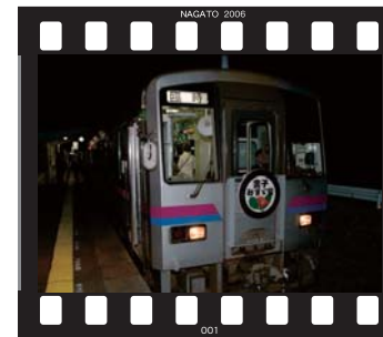
夢空間へといざなう「夢列車」