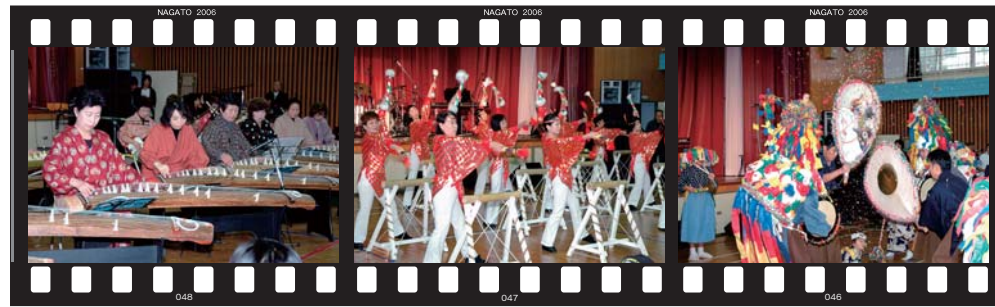
千種の会「棚田の里」 「祭りだワッショイ」銭太鼓 後畑楽踊り