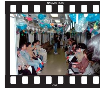
かんげき夢ツアーのはじまり