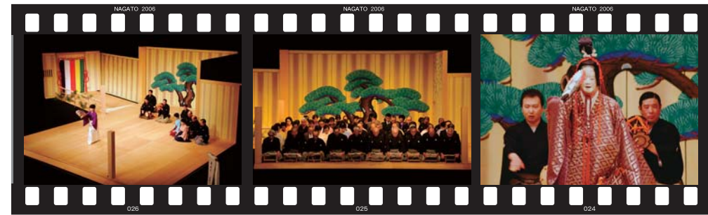
格式高い能楽舞台 宝生流山口県連合会 能楽師による模範演能