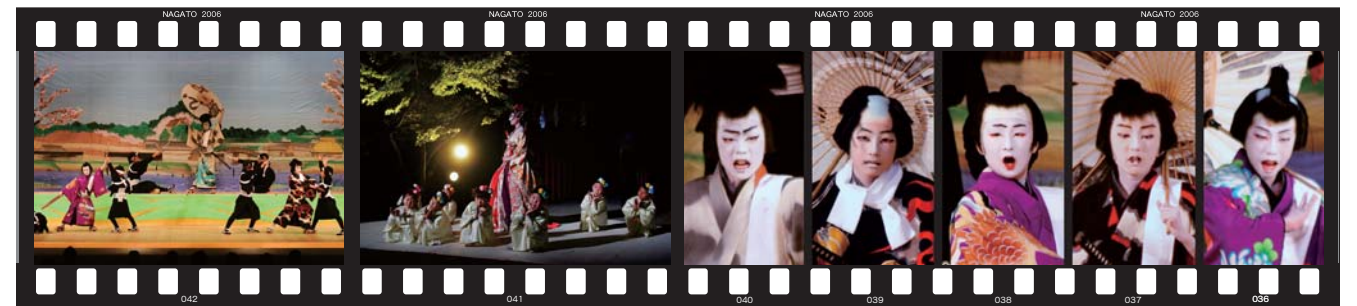
俵山小学校子ども歌舞伎「白浪五人男」