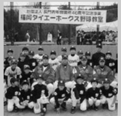
ダイエーホークス野球教室に参加

全国大会優勝!! これが僕たちの目標。そして大きな夢です。僕たち、油谷野球スポーツ少年団は野球が大好きな仲間です。週2回の練習をとても楽しみにしています。みんなの好きな練習はフリーバッティングやミニゲームです。なかなか思うように打てないけど一本ヒットが出るとうれしくて、またやる気になります。 僕は小さい頃、アクシデントで右ひじを骨折し、野球をやりたいなら左でと言われました。それから左で投げられるように家で練習をしました。昨年秋、背番号1番をもらい、県のジュニアの大会ではみんなで力を合わせてベスト4まで勝ち進みました。でも勝ったうれしさよりも負けたくやしさがみんなの心に強く残っています。今年僕たちが6年生です。宇野キ