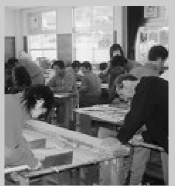
地域の方を講師に招き ふるさと学習

通中学校では、総合的な学習の時間を利用し、地域に根ざした活動を通して行っています。 夏は、地域の伝統行事である「鯨祭」で、全校男子が「鯨唄」を披露します。これは赤ちゃん鯨を供養するための歌で、昔から通地区で歌い継がれてきました。今年度も地域の鯨唄保存会の人たちに学校へ来ていただき、その歴史を聞いたたり、歌の指導を受けたりしました。 冬には「ふるさと学習」を地域の方を講師として招き、「昔の遊び」「小物作り」「郷土料理」の3つのグループに分かれて学習しました。僕は「昔の遊び」を選び、竹とんぼや竹でつぼうなどを講師の人に教わりながら、楽しく作ることができました。