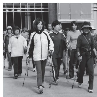
▲ウォーキングで健康づくりの第1歩