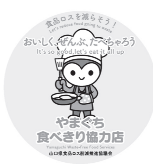
▲やまぐち食べきり協力店 公式ステッカー