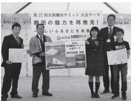
▲中国地方で初の全国柵田サミットが行われる

「柵田はみんなの風景画」 〜柵田でつながる未来の鏡〜 全国各地から多くの柵田ファンがお越しになります。心のもつたおもてなしでお客様を温かくお迎えするため皆さんのご協力をお願いします。