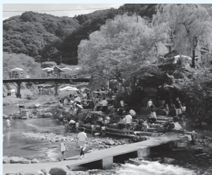
▲利活用で休み・佇む河川空間に