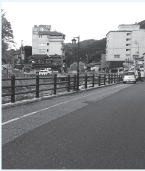
▲社会実験前の様子

長門湯本温泉では温泉街の再生に向けて観光まちづくりの取組が進んでいます。そぞろ歩きが楽しめる温泉街をつくるためには、町並みを整備するだけではうまくいきません。大事なことはどう作るかだけでなくどう使うか、今あるものを上手に活用していくことです。