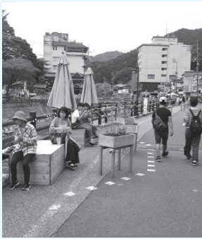
▲そぞろ歩き・空間が楽しめる利活用

長門湯本温泉では温泉街の再生に向けて観光まちづくりの取組が進んでいます。そぞろ歩きが楽しめる温泉街をつくるためには、町並みを整備するだけではうまくいきません。大事なことはどう作るかだけでなくどう使うか、今あるものを上手に活用していくことです。