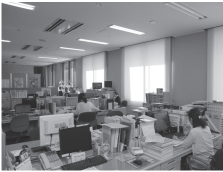
▲働きやすい環境づくりに取り組む

■仕事と家庭の両立のために 半日単位での休暇の取得が可能なことや、フレックスタイトムの活用により、個別の要望に