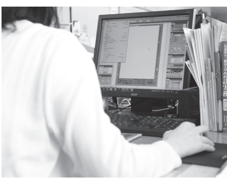
▲キャリアアップのための支援も

また、キャリアアップのための業務に関する知識の習得や研修会への参加を支援し、職員の能力・意識の向上を図り、働きやすい、働きがいのある職場を目指しています。 ■制度を活かしてワークライフバランス 「フレックスタイトム制を利用して仕事と生活のバランスを