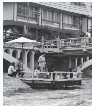
▲川床も再び設置します

音信川・大寧寺川に川床を設置して運営方法を検証します ②交通再編と道路空間活用 人と車が共存できる交通にむけて、地域がめざすエリア交通計画の将来の形を実験的に再現して影響を検証します。また、道路空間にベンチや店舗を設置して活用する実験も行います