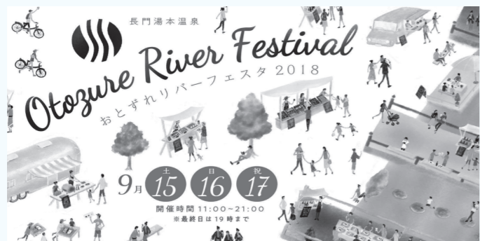
▲未来の温泉街をイメージして体感できる3日間

音信川・大寧寺川に川床を設置して運営方法を検証します ②交通再編と道路空間活用 人と車が共存できる交通にむけて、地域がめざすエリア交通計画の将来の形を実験的に再現して影響を検証します。また、道路空間にベンチや店舗を設置して活用する実験も行います