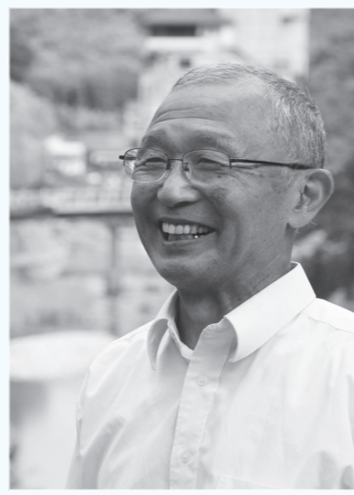
《略歴》 1949年生まれ。長門市在住。湯本区自治会長。趣味：ゴルフ、草取り