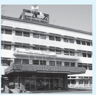
▲建て替えられる現庁舎

庁舎建設基本構想(案)に対するパブリックコメントを募集しています 市総務課では、庁舎建設についてのパブリックコメントを募集しています。 ■募集期間 4/23(木)まで ■閲覧場所 本庁3階情報閲覧コーナー、各支所、各出張所、市ホームページ ■提出方法 閲覧場所に備え付けまたは市ホームページに掲載の専用紙に記入の上、持参または郵送、ファックス、メールで提出 ■提出先・問い合わせ Tel 759・4192 長門市東深川1339-2 長門市役所 企画総務部総務課行政係 gyosei@city.nagato.lg.jp Tel 23・1194 Fax 22・6345