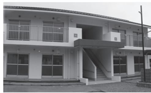
▲完成した田屋床市営住宅 (E棟)

川尻・伊上)では、ワンストップサービスとして、税証明だけでなく、戸籍謄本抄本・住民票・印鑑登録証明書なども発行しています。こちらもあわせて利用してください 問い合わせ 市民課窓口係 TEL 23・1128