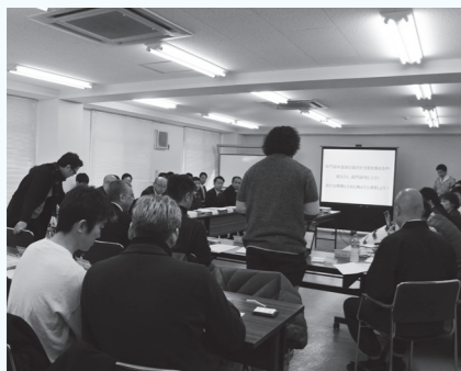
▲事業者や関係者が事業プランを練る

長門湯本温泉では温泉街の再生を目指して「長門湯本温泉観光まちづくり」に取り組んでおり、公民が連携した取組が進む中、民間の力を呼び込むプロジェクトが始まっています。