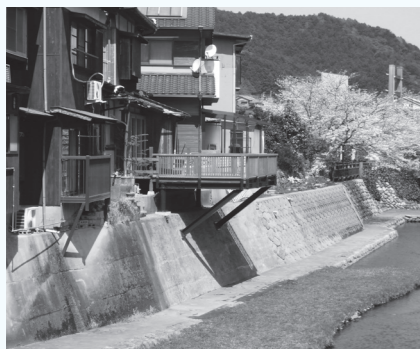
▲4月から「置き座」の仮設がスタート

「癒やされ方改革」をコンセプトに新たな民間事業を募集しています。金融と地方創生の専門である株式会社YMF ZONEプランニングが主催の「事業者オーディション」では、コンセプトに共感する事業者が参加、空き家等を活用した