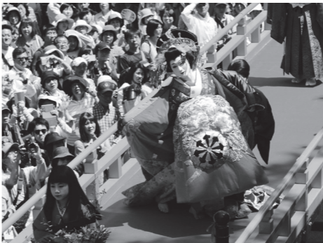
▲先帝祭・上ろう参拝

平船合戦（海上パレード）、八丁浜総踊り ・5/4(金) 巖流島 巖流島フェスティバル 問い合わせ 下関市観光政策課 TEL 083・231・1350