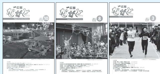
第1位 10月号 おとずれリバーフェスタ 第2位 8月号 シャボン玉ショー 第3位 3月号 日置駅伝大会

1月12日から31日まで市内15カ所で開催した「広報ながと表紙コンテスト」では、投票・アンケートにご協力いただき、ありがとうございました。投票総数は221票で、得票数1位から3位までの表紙は下記のとおりです。なお、アンケートでいただいたご意見・ご要望は、今後の広報紙づくりに生かしていきます。