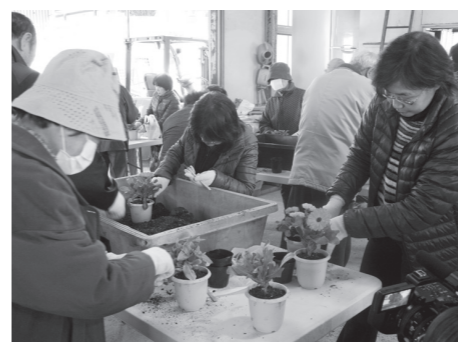
■昨年の講習会の様子

第2回花と緑のまちづくり講習会 長門市花と緑のまちづくり推進協議会では「土からつくる花づくり」をテーマに、次のとおり講習会を開催します。 また、今回は大津緑洋高校日置校舎の施設見学も行います。 ■日時 3/17(土) 10:00~ ■場所 大津緑洋高校日置校舎 ■募集人数 30人(先着) ■参加料 無料 ■応募方法 市民課市民活動準備室まで電話で連絡