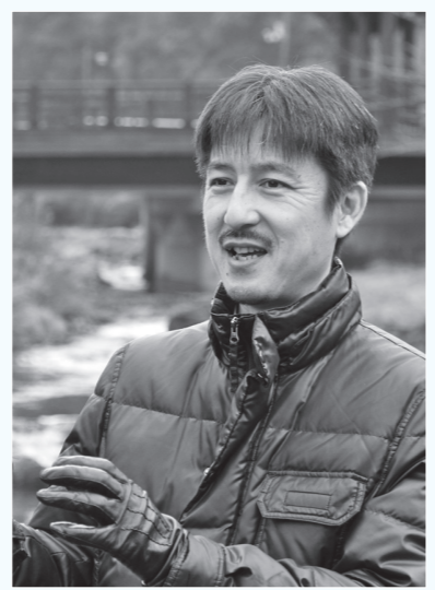
《略歴》 1968年生まれ。有限会社カネミツヒロシセツケイシツ取締役。趣味：旅行、食巡り、オペラ観賞