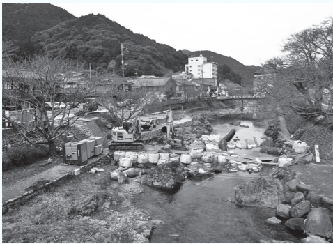
▲ランドスケープデザインを取り入れ、ハード整備が進む

ソフトとハード整備をコーディネートしながら、まちにとって良い風景を地域住民や観光客、店舗など、その場所にいるさまざまな人々とともに作りあげていくことで、地域の価値を高めていきます。