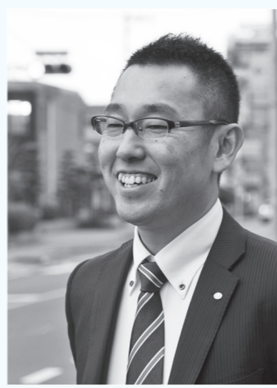
《略歴》 1977年生まれ。株式会社日本海コンサルタント所属。趣味はまち歩き、ポタリング、バスケットボール