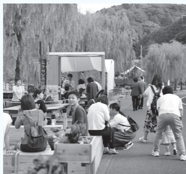
▲道路の一部を休憩スペースとして活用

道路は昔から人々の社会、経済、生活、文化を支え、時代に応じて発展を遂げてきました。これからも地域住民とともに今後の道路の整備や維持管理、交通の未来について考えて、賑わう温泉街を目指して取り組んでいきます。