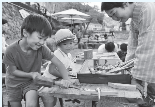
▲ワークショップなど様々な催し物が行われる

■期間 10/7(土)～9(月) 12:00～21:00 ■場所 長門湯本温泉街一帯 ■内容 ・ものづくりワークショップ ・あおぞらフードコート ・川辺のライブ&トーク ・川沿いかフェ&バー ・橋の上レストラン ※出店日時は各店舗により異なります。 ※一部のワークショップは有料となります ■問い合わせ 湯本温泉街みらい検討会議 TEL 25・3611