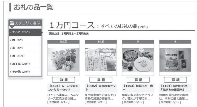
▲ホームページでの紹介例