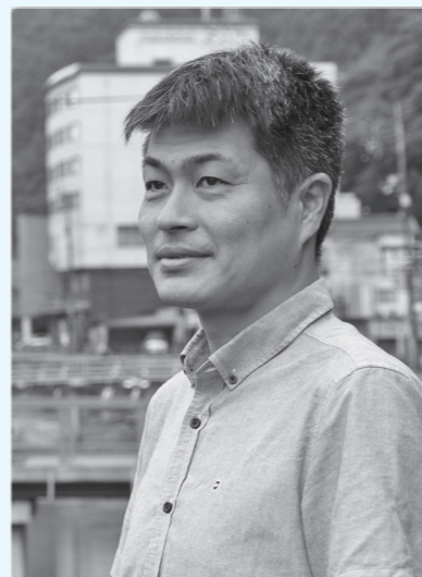
《略歴》 1971年生まれ。有限会社ハートビートプラン代表。趣味は旅。特技はビール一気飲み