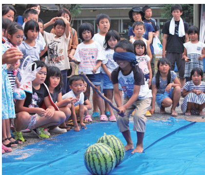
▲各方向から声が飛ぶスイカ割り

この日はシーカヤックや海水から塩を作る体験、宝探し体験などが行われ、夕食は地元食材を使ったバーベキューやスイカ割りを楽しみました。最後に一人前の海賊となった証として海賊証が参加者一人ひとりに手渡されました。