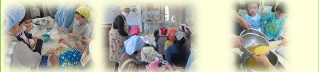
長門ゆずきちを使った親子クッキング